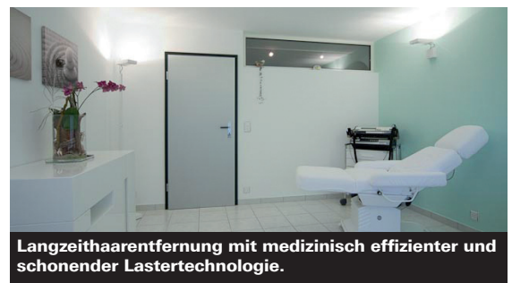
Langzeithaarentfernung mit medizinisch effizienter und schonender Lasertechnologie.

Noch detailliertere Informationen finden Interessierte unter www.cp-laser.ch . Sie erfahren mehr zur Vorbereitungsphase, zur Behandlungstechnik, deren Dauer und die Preise. Sie